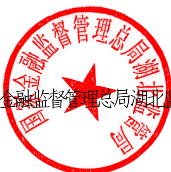
国家金融监督管理总局湖北监管局