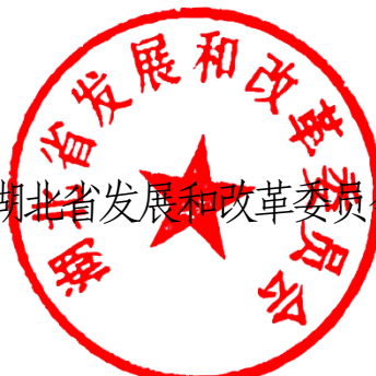
湖北省发展和改革委员会