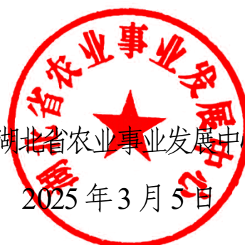
湖北省农业事业发展中心