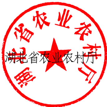
湖北省农业农村厅