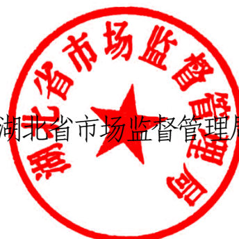
湖北省市场监督管理局